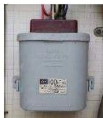
小型コンデンサー